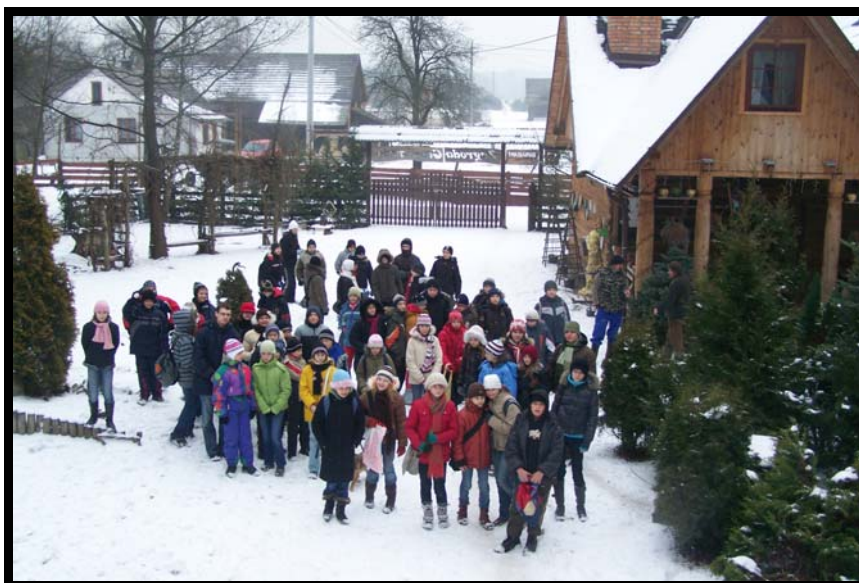
Łązek Garncarski – Zagroda Garncarska

Monika Straub, PSP III im. Bohaterów Westerplatte w Stalowej Woli województwo podkarpackie