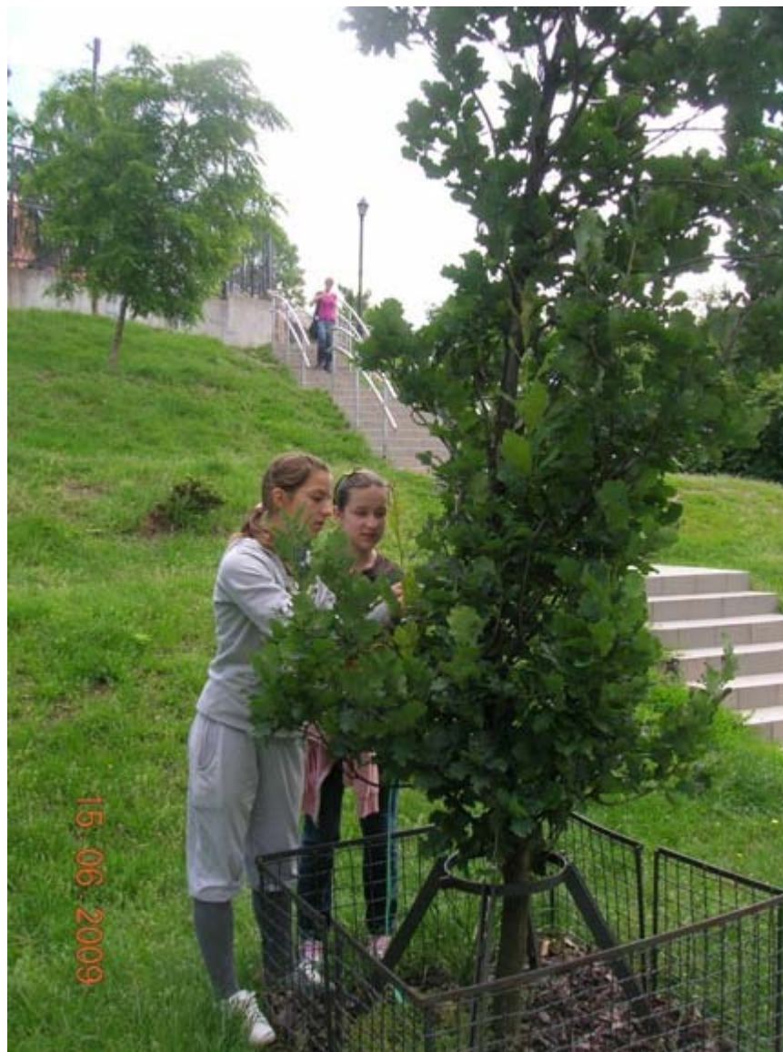
Pomiar obwodu pnia dębu szypułkowego (nr 5) na wysokości 130 cm dnia: 15.06.2009r. Dolina Pojednania