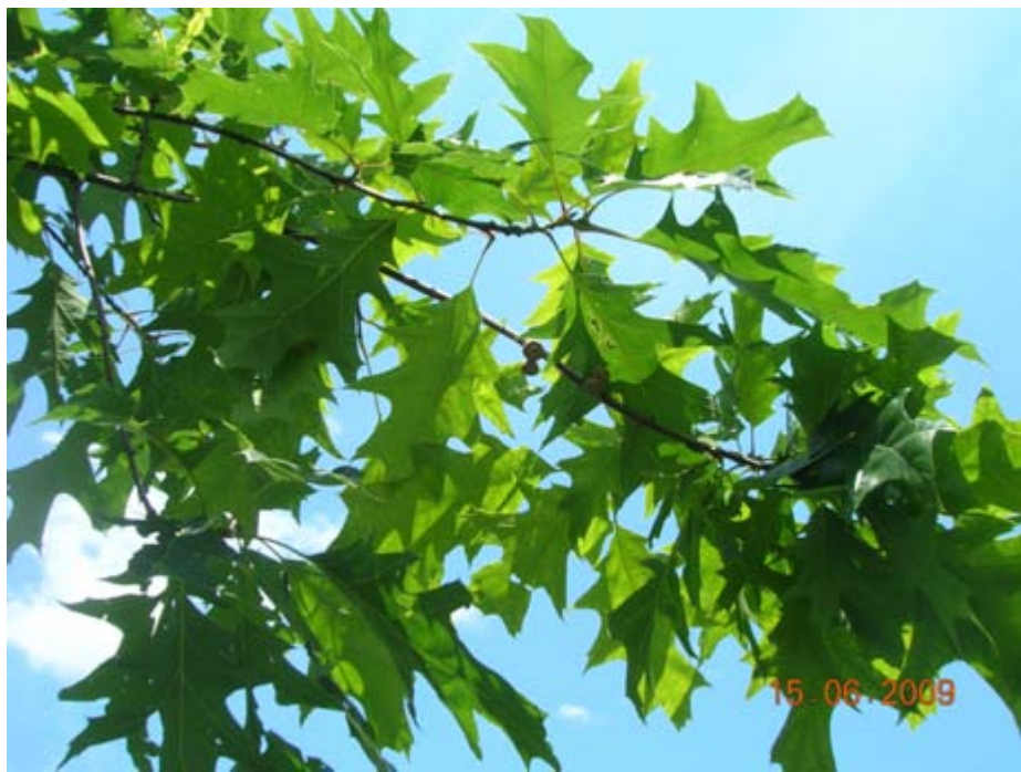
Owoce i liście dębu czerwonego.