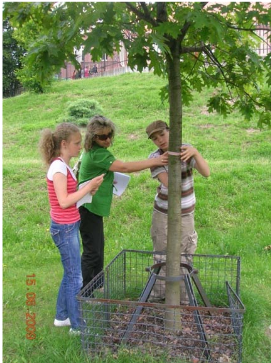
Pomiar obwodu pnia dębu czerwonego (nr 4) na wysokości 130 cm dnia: 15.06.2009r. Dolina Pojednania