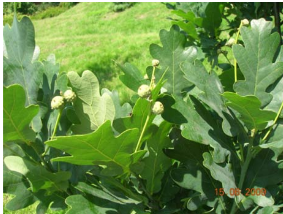
Owoce i liście dębu szypułkowego.