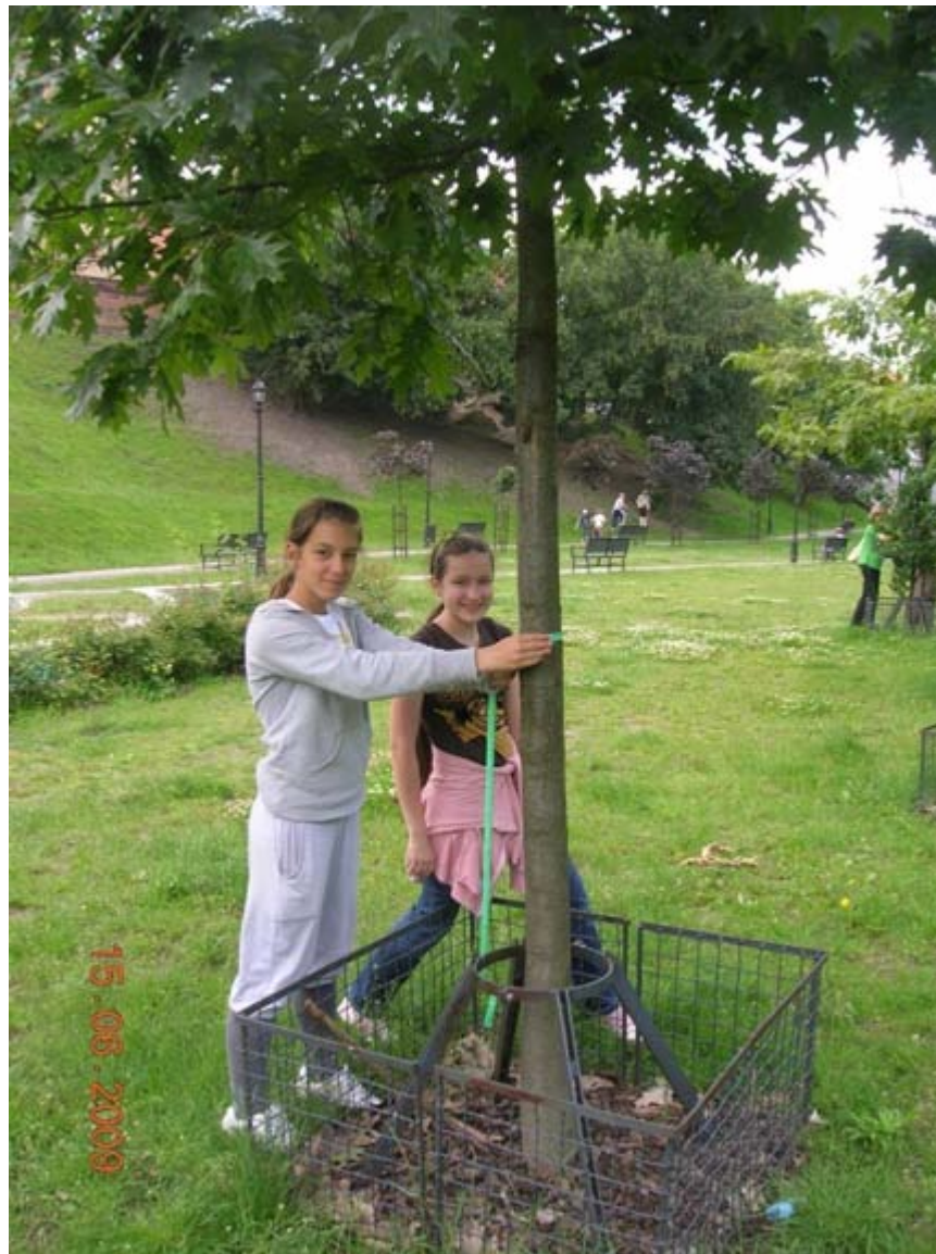
Pomiar obwodu pnia dębu czerwonego (nr 2) na wysokości 130 cm dnia: 15.06.2009r. Dolina Pojednania