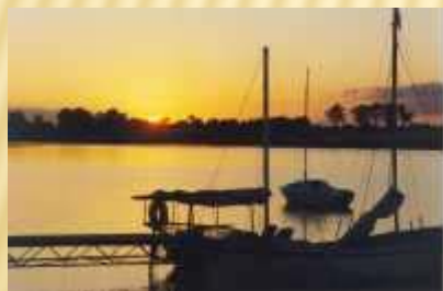
Zachód słońca – przystań w Kłecku

W północnej części Lednickiego Parku Krajobrazowego w Waliszewie w 1997r. utworzono ścieżkę przyrodniczą - obiekt o wspaniałych walorach przyrodniczych. Trasa o długości 7 km przebiega przez Gminę Kłecko i Gminę Kiszkowo, obejmując kolejno miejscowości: Waliszewo, Dziećmiarki, Kamionek, Waliszewo.