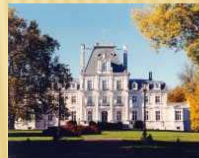
Pałac - Zakrzewo