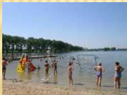
Plaża i kąpielisko w Kłęcku

Znakomitymi warunkami hotelowymi (pokoje, restauracja, korty tenisowe) dysponuje Ośrodek Szkoleniowy BZ WBK w Zakrzewie, znajdujący się w kompleksie parkowo - pałacowym, położonym nad rzeką Mała Wełna. Stąd niedaleko do Jeziora Gorzuchowskiego i J. Lednickiego.