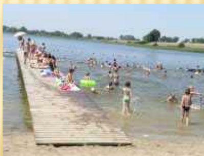
Pomost na kąpielisku w Kłęcku