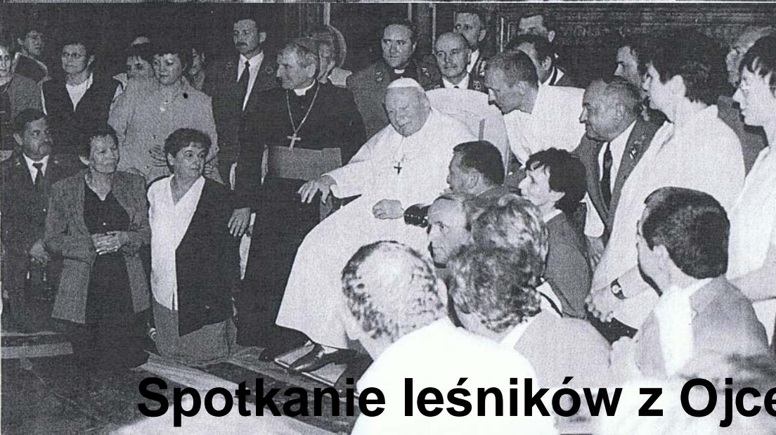
Spotkanie leśników z Ojcem Świętym