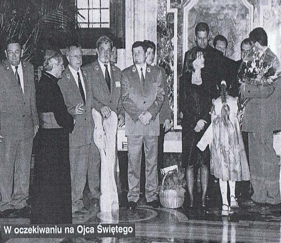
W oczekiwaniu na Ojca Świętego