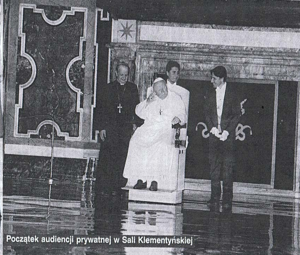
Początek audiencji prywatnej w Sali Klementyńskiej